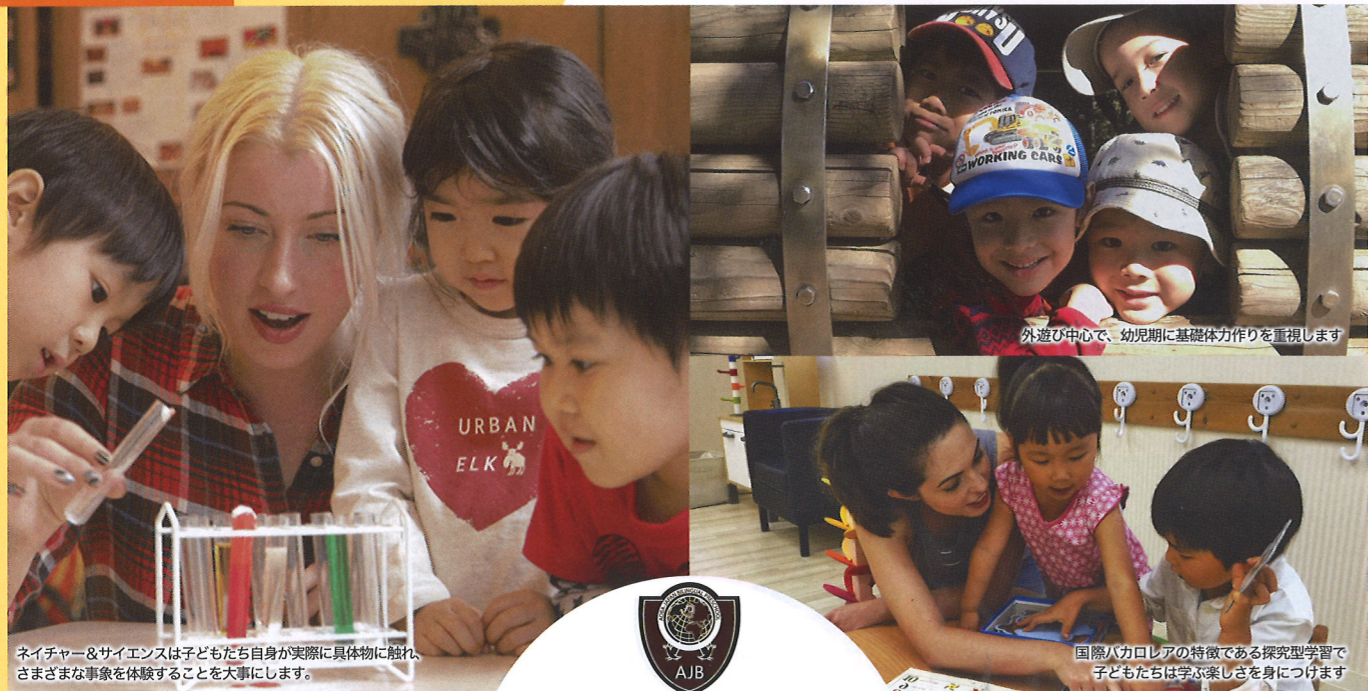
ネイチャー&サイエンスは子どもたちが実際に具体物に触れ、さまざまな事象を体験することを大事にします。