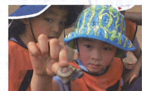
学び続けることの楽しさを、探究心を育みます

世界が舞台！IB×バイリンガルで 未来を創り出す可能性を引き出そう 「国際社会で活躍するグローバルリーダーの育成」 「自らの意思で人生を歩む人の育成」を旨とし、世界標準の一つである国際バカロレアアカリキュラムを導入、日英のバイリンガルな教育環境で提供しています。 幼児期は、大人が一方的に教え、答えをテストで再現させる教育よりも、子どもたちの興味関心、自発的に行動すること、そしてお友達同士のやり取りから学ぶことが大切と考えています。 子どもが挑戦・表現しようとしていけることを支援することで、生涯学び続ける動機となる好奇心と自己効 学び続けることの楽しさを、探究心を育みます