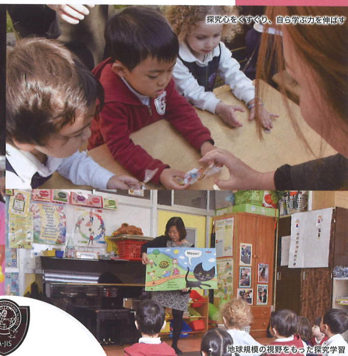
探究心をくすぐり、自ら学ぶ力を伸ばす