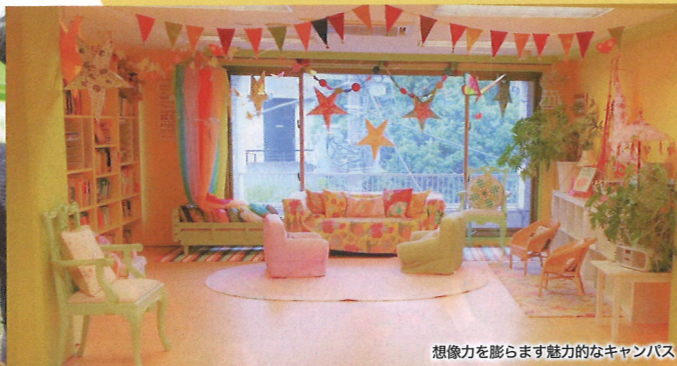
想像力を膨らます魅力的なキャンパス