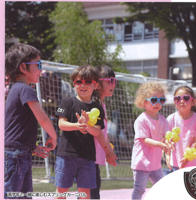
高学年と一緒に楽しむスプリングカーニバル

ネイティブ教師 帰国生・グローバルクラス (All Mix) 英語取り出しクラス (全て英語での授業)