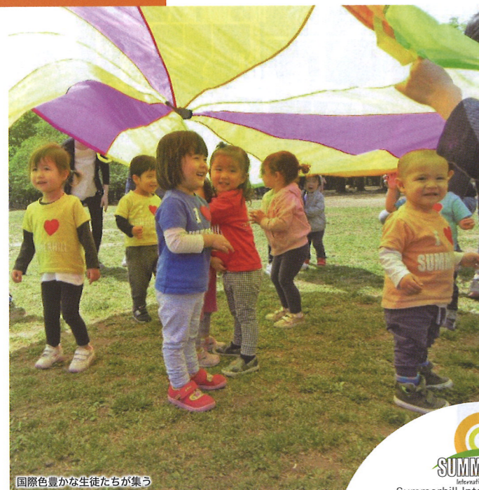
国際色豊かな生徒たちが集う