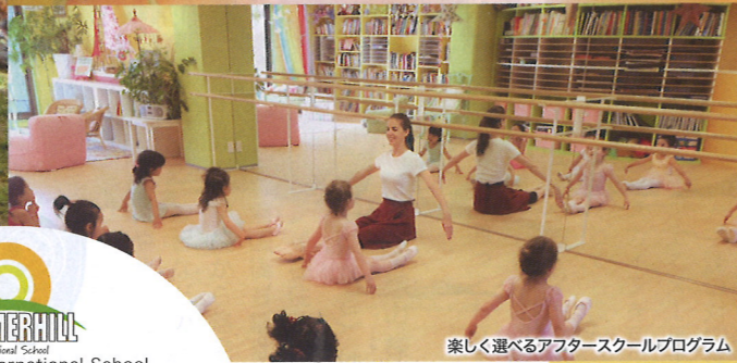
楽しく選べるアフタースクールプログラム