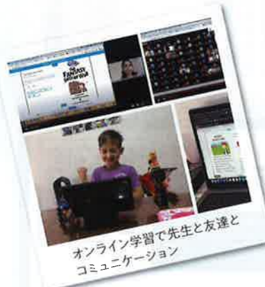
オンライン学習で先生と友達とコミュニケーション

アオバは教員、生徒、職員とも、色んなバックグラウンドを持った人が集まる場所です。見た目と話す言葉と住んでいた国が全て異なることもあれば、日本以外で生活をしたことがないけれど完璧なバイリンガルな生徒や先生もいます。そんな中で帰国生もたくさんおり、豊富な体験を生かしてアオバのラーニングスタイルを楽しんでいます。アオバはグループワークが多く、チームでコミュニケーションを取りながら決まった答えのない課題に力を合わせて取り組み、勉強と同時にどうなっているかわからない将来に向けて人として必要なスキルを身につけていきます。ホームページにバーチャルツアーなどもあります。ぜひご覧になってください。