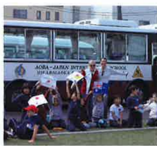
アオバの生徒と親御さんたち