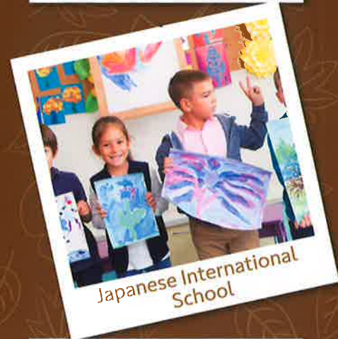
Japanese International School