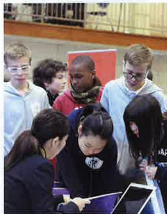
さまざまなバックグラウンドを持つ生徒たちのチームワーク!